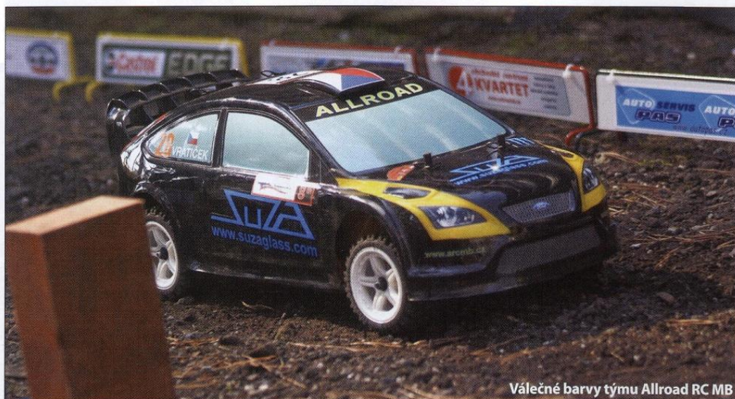
Válečné barvy týmu Allroad RC MB

Třetí etapa tvořená dvojicí RZ 5–6 (Stránka 1 a 2) zavedla jezdce